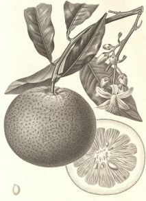
ORANGE DE NICE Arbustif. 1830.