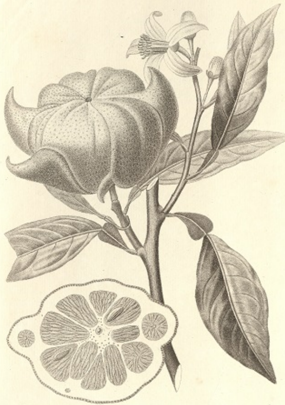
76 BIGARADIER A FRUIT CORNICULE. Melangeo a frutto cornuto.