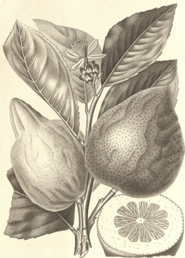
CEDRATIER DE FLORENCE.