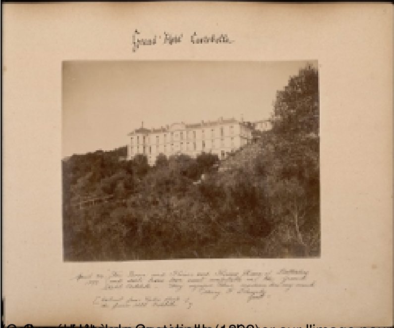
Grand Hôtel Costebelle (1902) sur l'image pour un affichage en plein écran)