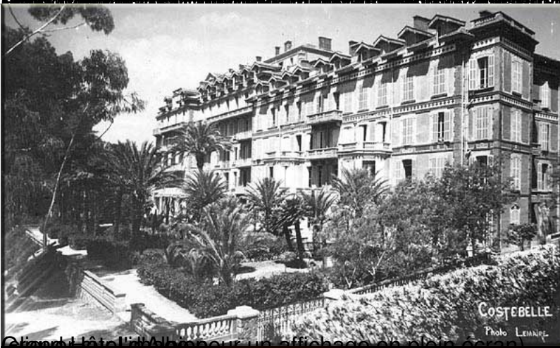
Grand Hôtel Costebelle sur un affichage